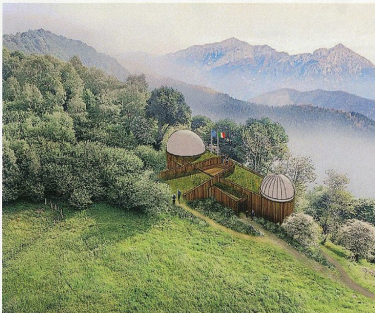
Il rendering del progetto per il nuovo planetario a Sormano